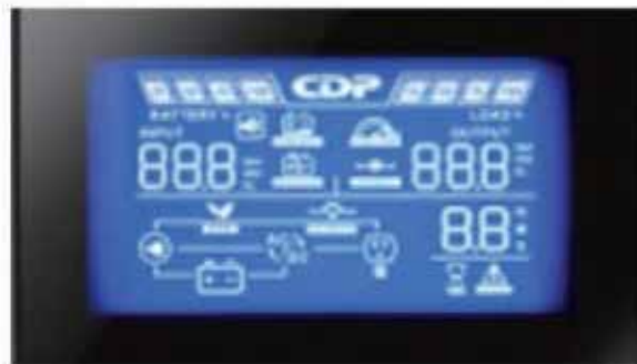
Muestra voltajes de entrada, salida, tiempos de autonomía y carga de batería