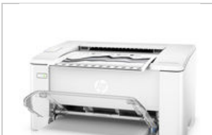
Left facing closed