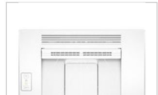
Top view open