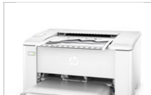
Left facing horizont